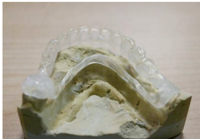
Férula para toma de registros

El montaje de esta prueba la realizaremos con dientes de tablilla montados a término. La utilización de las prótesis antiguas del paciente para esta elabora-