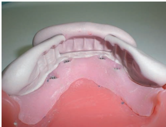
Preparación de pilares para prótesis provisional basada en frente de prueba de dientes