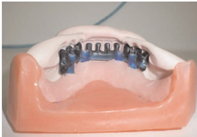
Encerado para refuerzo metálico con frentes de prueba previa a colocación de implantes