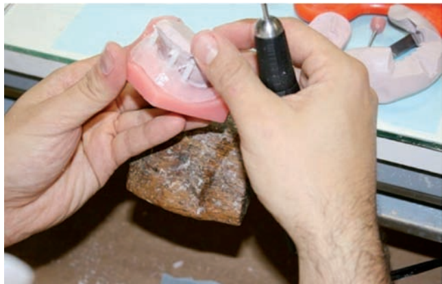
Ferulización de aditamentos para confección de prótesis provisional