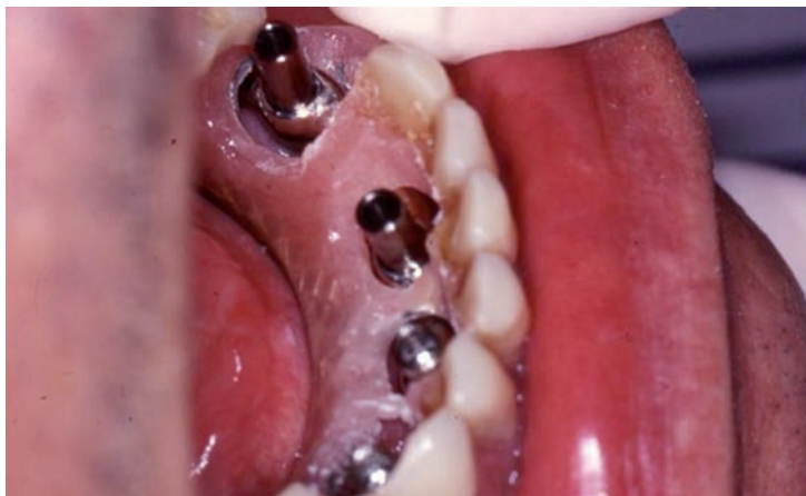
Toma de registro con prueba de dientes

obtendremos una posición fiel de los implantes. Puede parecer que es poco tiempo para la realización de esta prótesis provisional, pero teniendo en cuenta que parte del trabajo ya está hecho de un modo previo esto es posible y de ese modo cumpliremos con el compromiso y concepto de prótesis sobre implantes con carga inmediata.